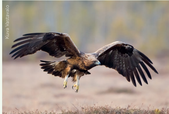
Selvitysten perusteella näyttää siltä, että hankkeita pitää sopeuttaa paremmin kotkan liikkumiseen.

Selvityksen mukaan hankkeiden yhteisvaikutukset maakotkareviiriin ovat kohtalaiset. Mallinnusten perusteella