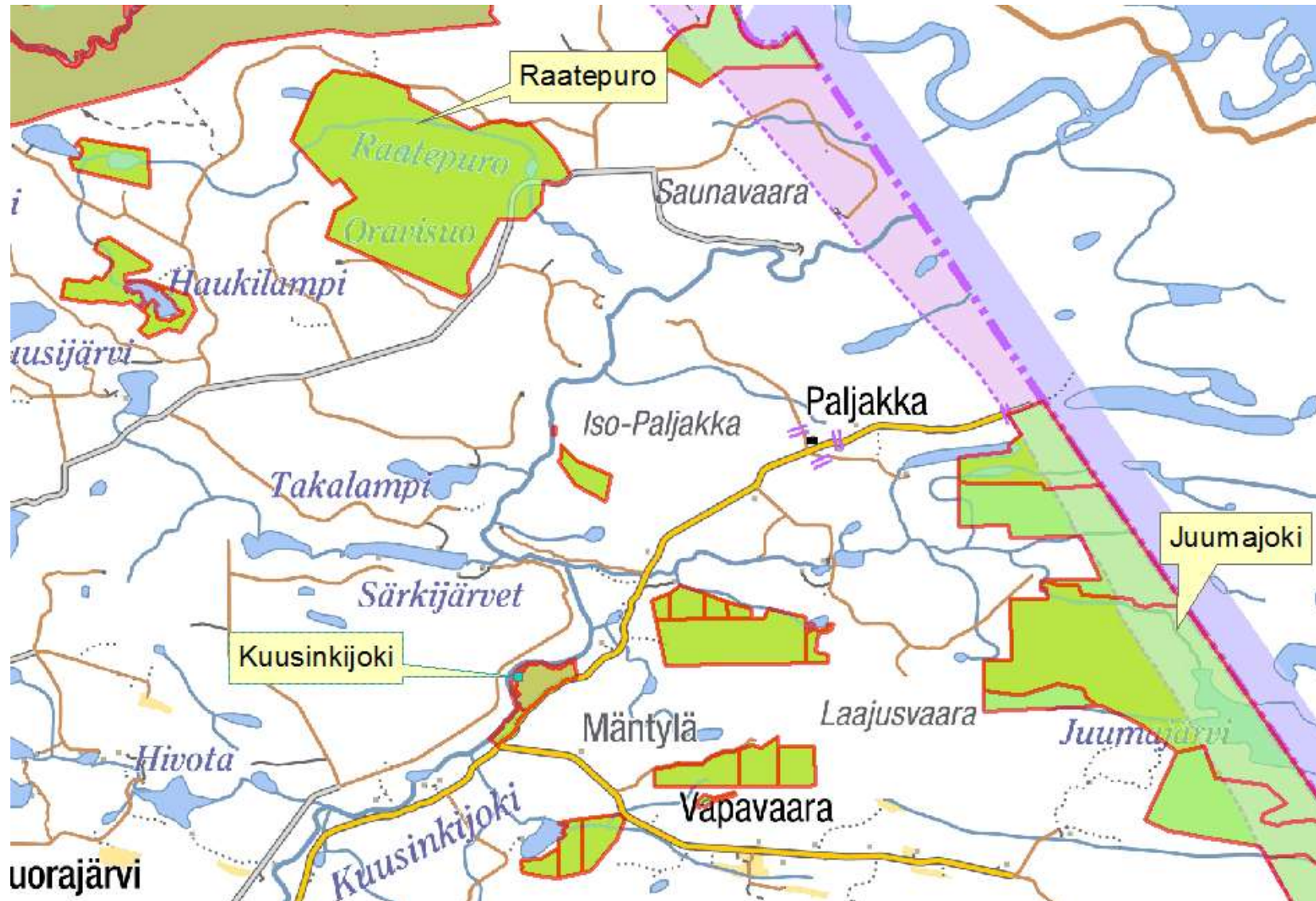
Liite 1. Kuusinkijoessa, Raatepurossa ja Juumajoessa sijaitsevat Metsähallituksen hallinnoimat alueet.