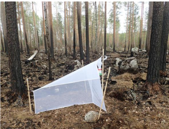
Kuva 19. Malaise-pyydys Mal-02.