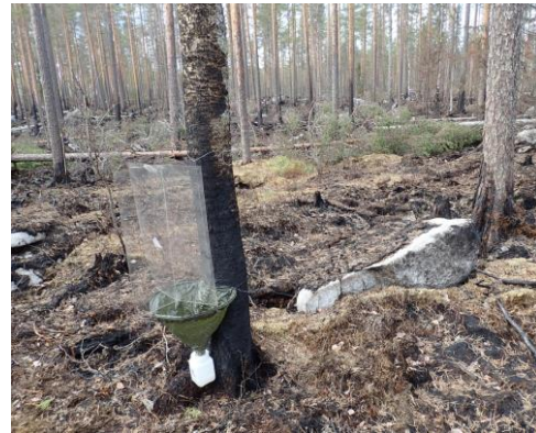
Kuva 18. Ikkunapyydys TWT-15.