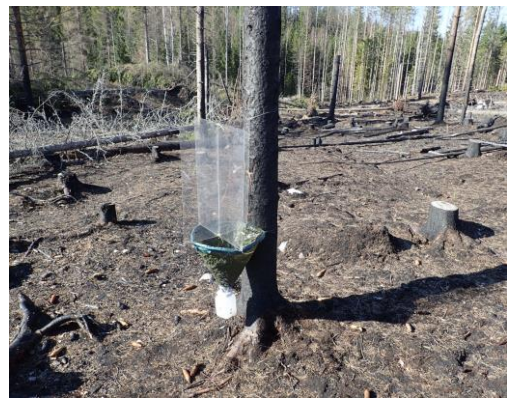
Kuva 2. Ikkunapyydys TWT-02.