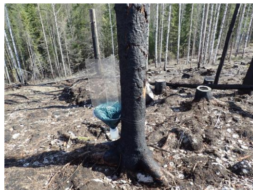
Kuva 8. Ikkunapyydys TWT-08.