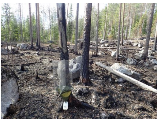
Kuva 13. Ikkunapyydys TWT-10.