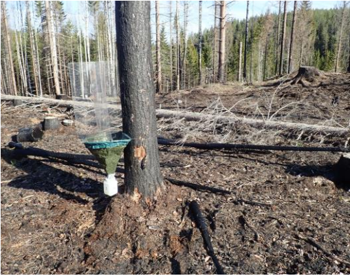
Kuva 1. Ikkunapyydys TWT-01.