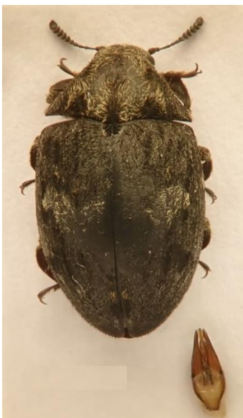
Kuva 22. Byrrhus geminatus , Suomelle uusi nuppolaji.