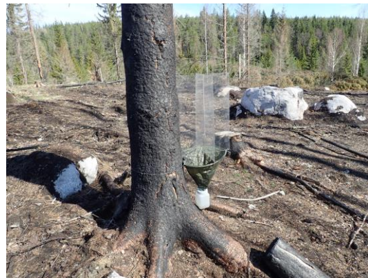
Kuva 6. Ikkunapyydys TWT-06.