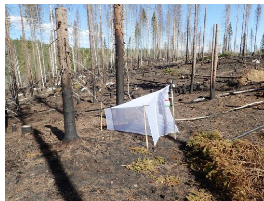
Kuva 12. Malaise-pyydys Mal-01.