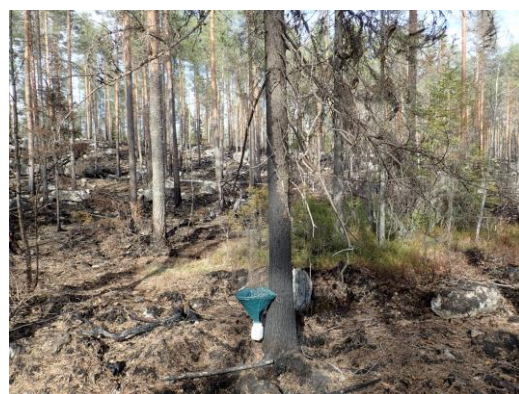
Kuva 14. Ikkunapyydys TWT-11.