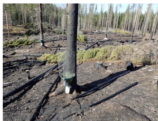
Kuva 4. Ikkunapyydys TWT-04.