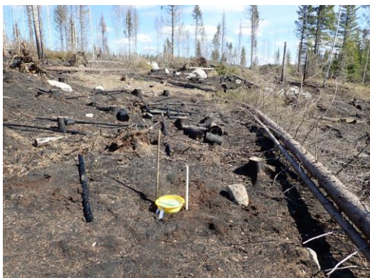
Kuva 11. Keltavati-ikkunapyydys Kvi-02.