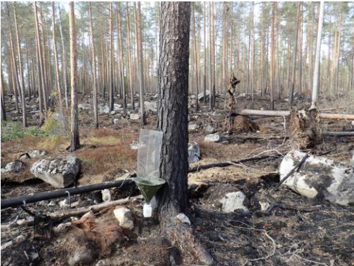
Kuva 17. Ikkunapyydys TWT-14.