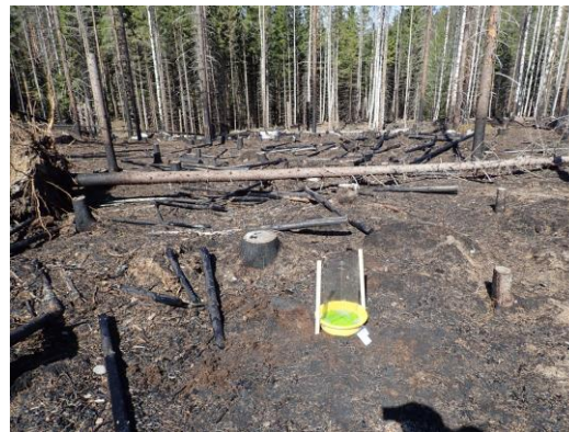
Kuva 10. Keltavati-ikkunapyydys Kvi-01.