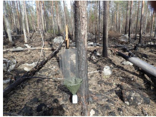
Kuva 16. Ikkunapyydys TWT-13.