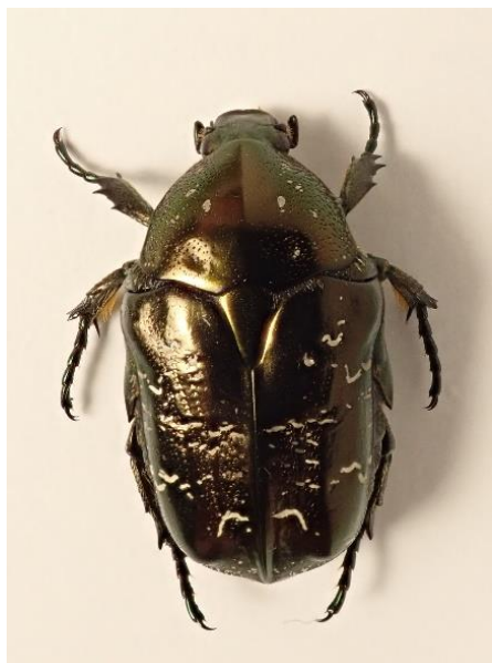
Kuva 20. marmorikuoriainen ( Protaetia marmorata ).