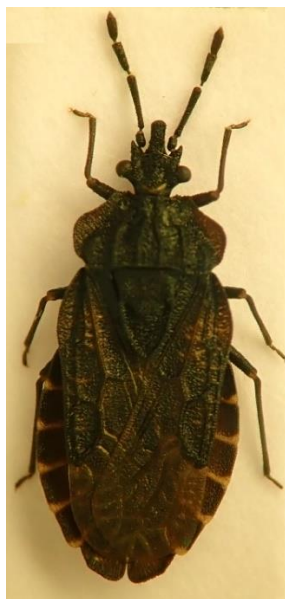
Kuva 23. tuhkalatikka ( Aradus laeviusculus ).