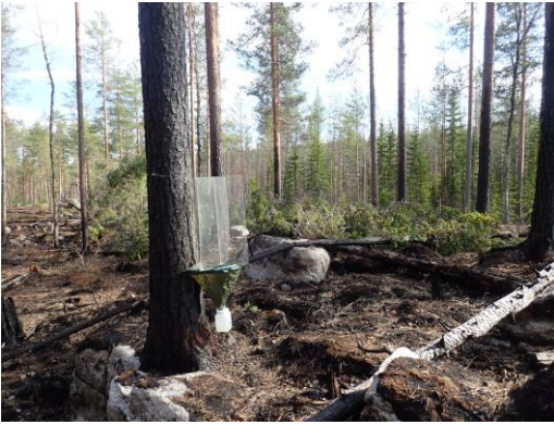
Kuva 15. Ikkunapyydys TWT-12.