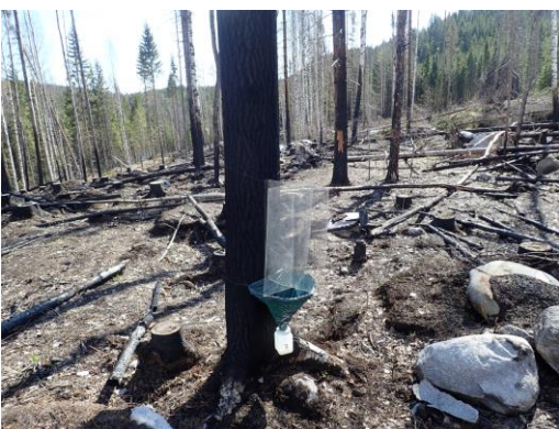
Kuva 7. Ikkunapyydys TWT-07.