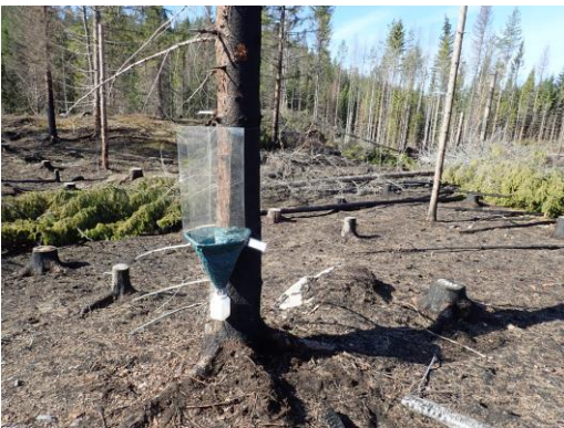
Kuva 3. Ikkunapyydys TWT-03.