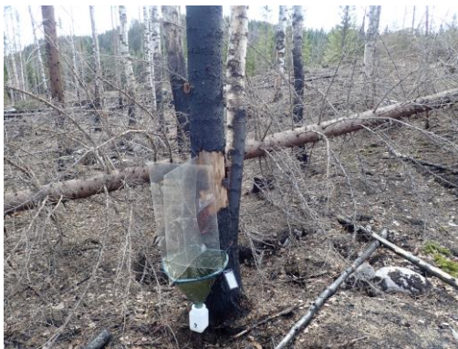
Kuva 9. Ikkunapyydys TWT-09.