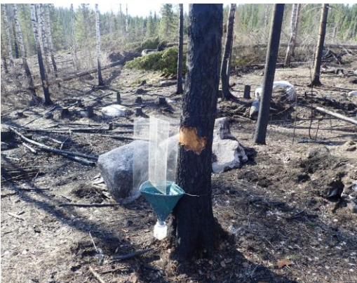
Kuva 5. Ikkunapyydys TWT-05.