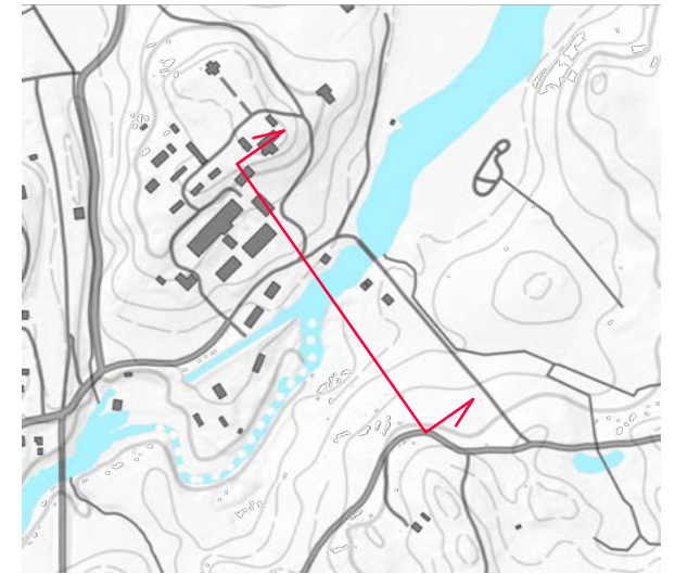
Leikkauskohdan sijainti kartalla