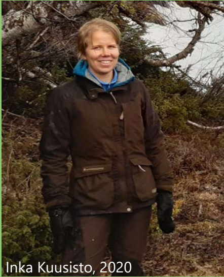
Inka Kuusisto, 2020