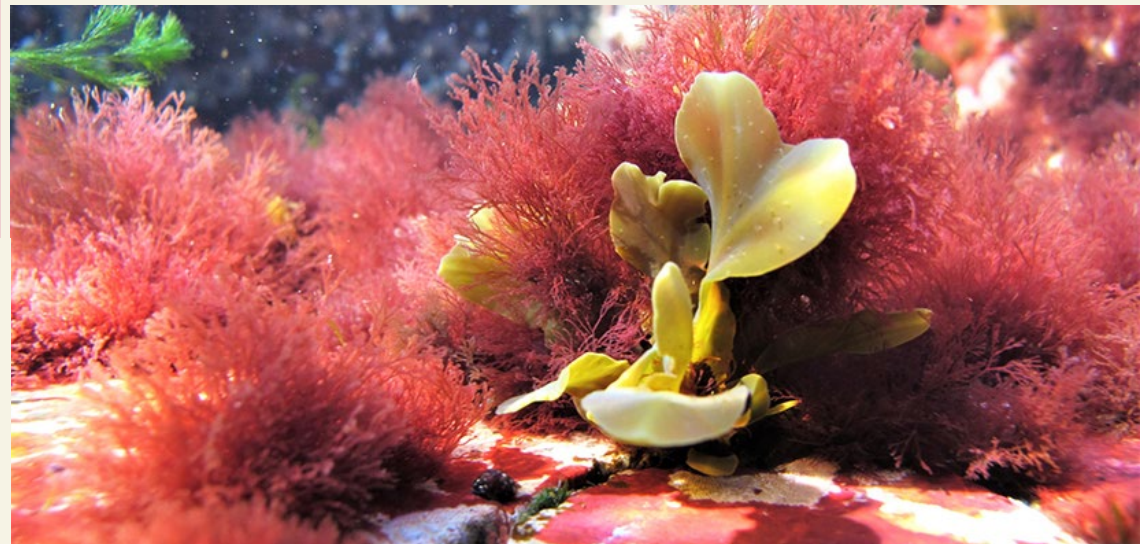
Rakkohauru - Blåstång.