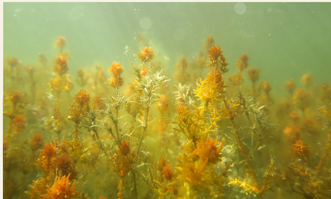
Näkinpartaisniitty - Kransalgång.