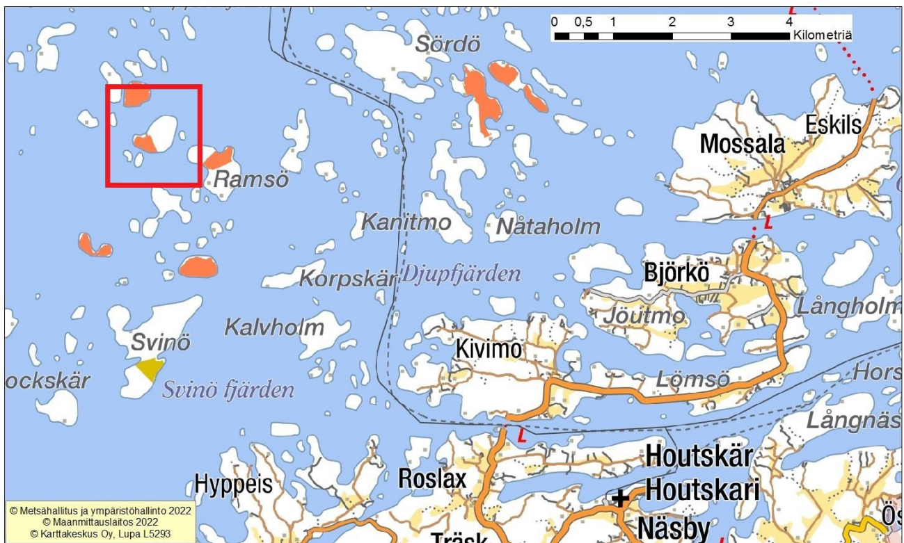
Kartta 1. Hällskärin sijainti Saaristomerellä Houtskarista luoteeseen