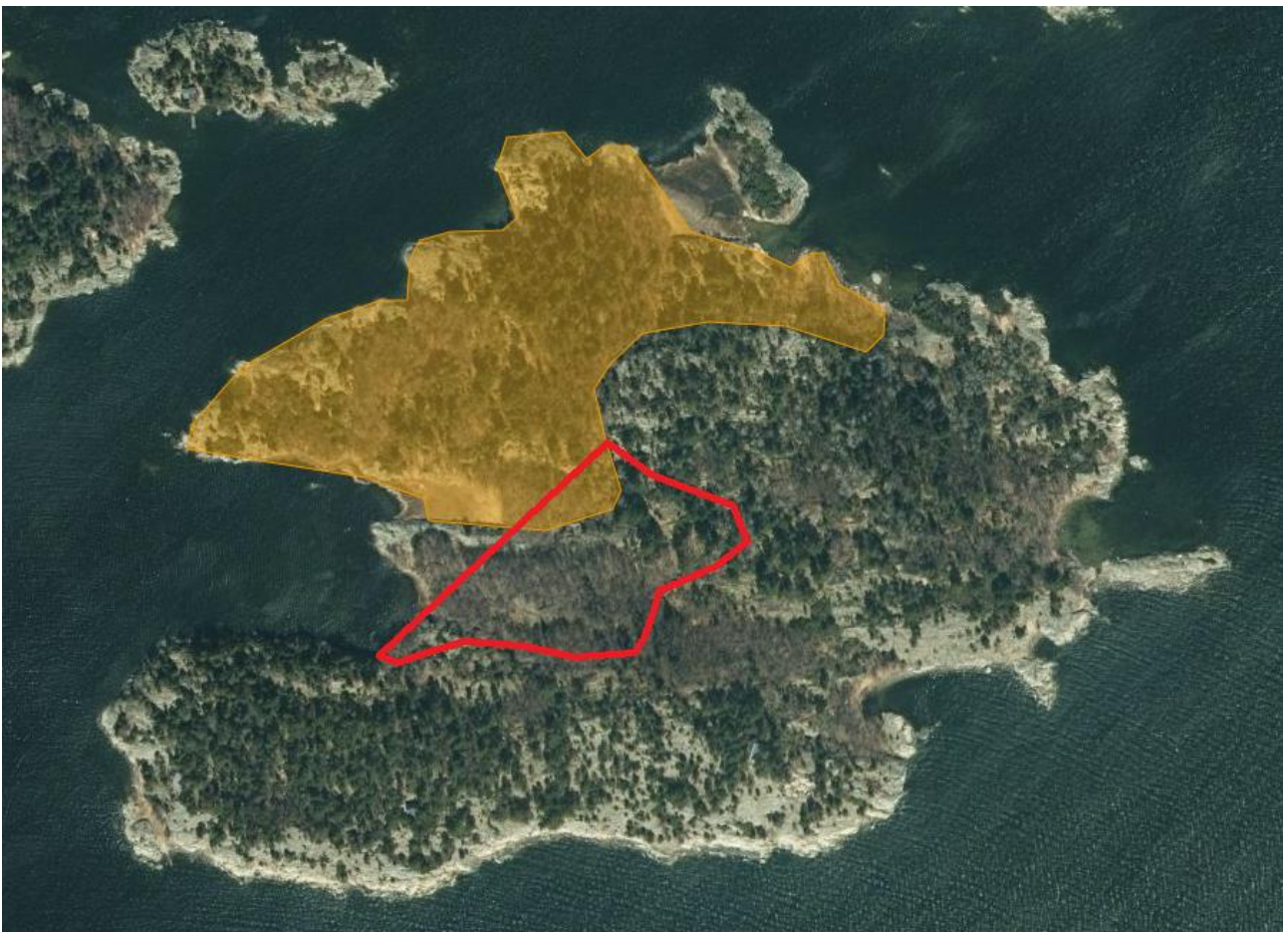
Kartta 2. Suunniteltu hoitoalue (alustava) ja lisätoivealue Ejskäretin saarella