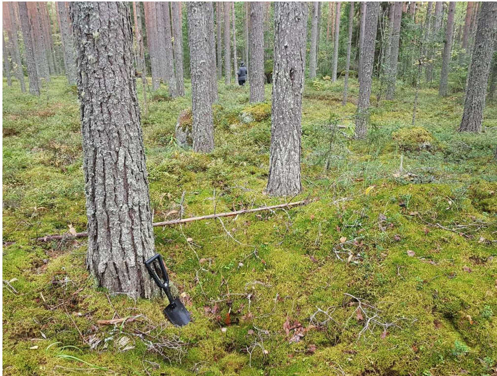
Kuva 2. Kenttälapion kohdalla on hiilimiilu 1. Kuva on otettu lounaasta.