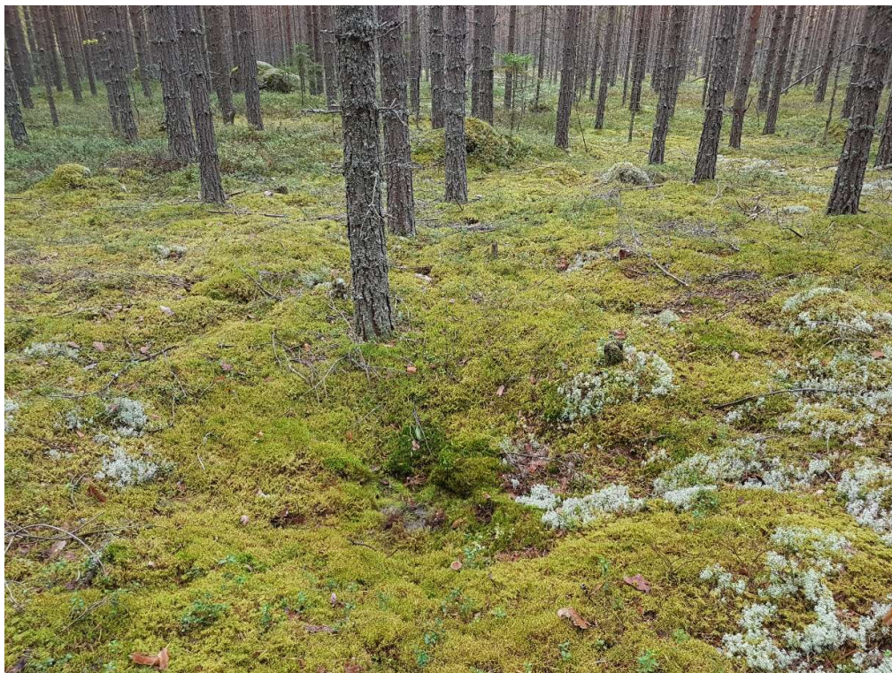
Kuva 3. Kuvassa on hiilimiilu 2. Kuva on otettu etelästä.