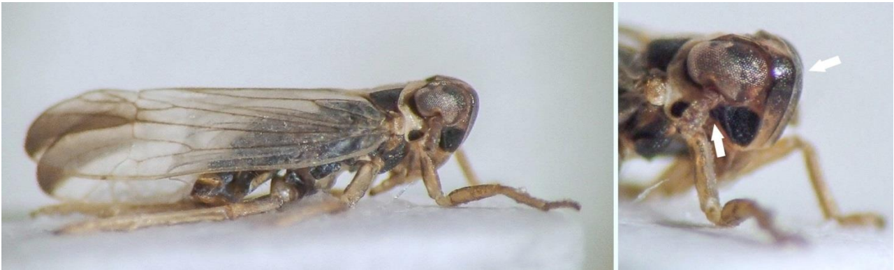
Kuva 2. Kivisuolta löytyi maalle uutena lajina Kelisia sima , jonka erottaa lähilaji K. guttulata peitinsiiven kärjen tumman alueen rajautumisesta (vain yksi solu kokonaan tummentunut), pään etummaisesta täplän laajuudesta, tummasta otsan yläosasta sekä aedeagusin pituudesta