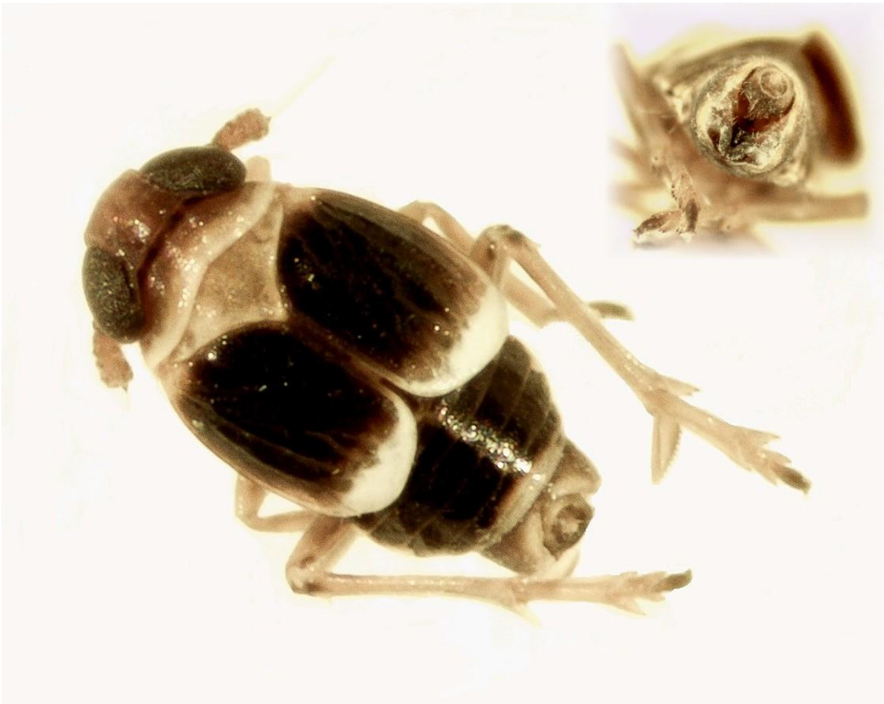
Kuva 1. Erittäin uhanalainen korpikirpukas löytyi Kivisuolta 15.7.2020