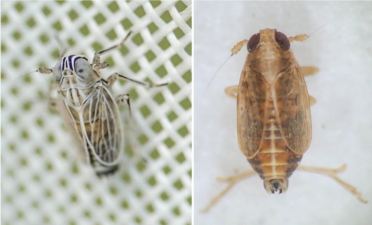
Kuva 3. Kaksi Kivisuon silmälläpidettävää kannuskaskaslajia: vasemmalla kuljukirpukas ja oikealla siniheinäkirpukas. Kivisuo 2020