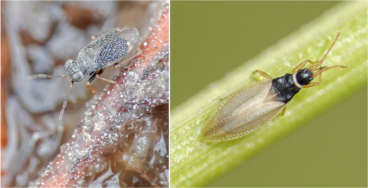
Kuva 4 (vas). Ruoppakirppulude Haapasuolla 15.7.2020. Kuva 5 (oik). Hännyskorulude Kivisuolla 15.7.2020