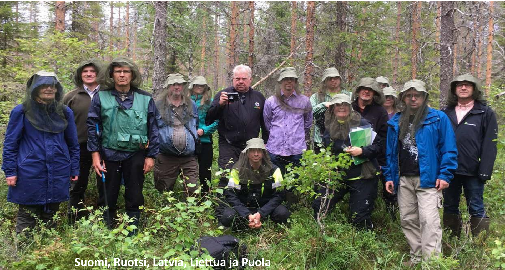
Suomi, Ruotsi, Latvia, Liettua ja Puola