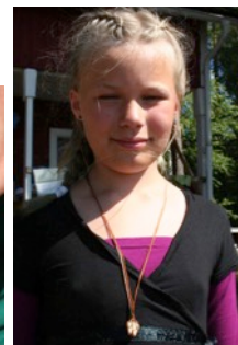
Ensimmäinen etsittiin kaunis kivi ja sitten solmeiltiin verkko – siitä tuli koru!