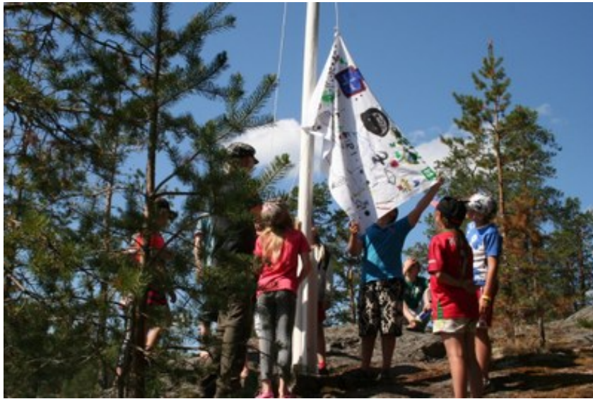
Lasten suunnitteleman leirilipun nosto oli hieno hetki

Tänä vuonna helle toi oman lisänsä leiriin. Aikaa varattiin todella paljon uimiseen, ja se olikin lasten mielestä parasta leirissä. Lisäksi huolehdittiin riittävästä veden juonnista sekä lippisten ja hellehattujen käytöstä. Leirin pidempää päiväretkä saaren luontoon piti hieman lyhentää paahtavan sään takia.