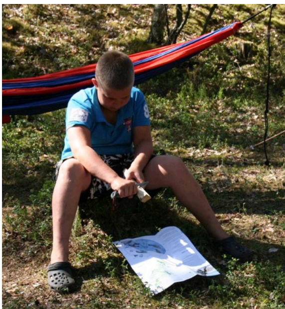
Leirillä opetettiin mm. kirveen ja puukon käyttöä.