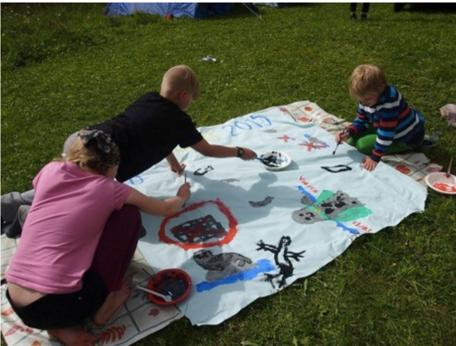
Kaikki saivat kuvittaa leirilippua.

Kiitokset kaikille 2015 -vuoden leiristä!