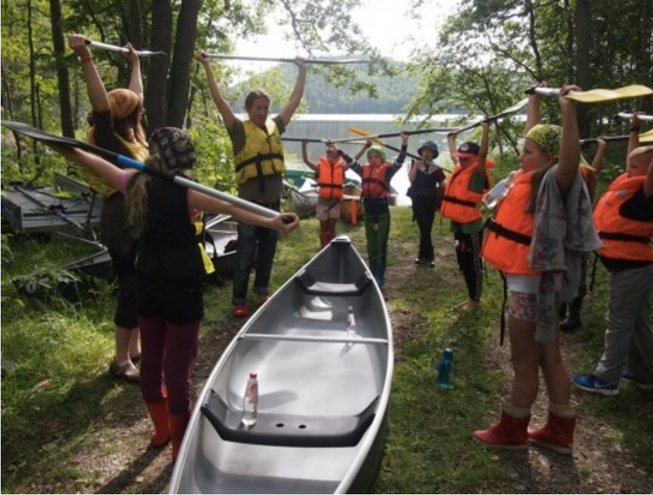
Ennen vesille pääsyä harjoiteltiin rannassa hyvä tovi melonnan sääntöjä.