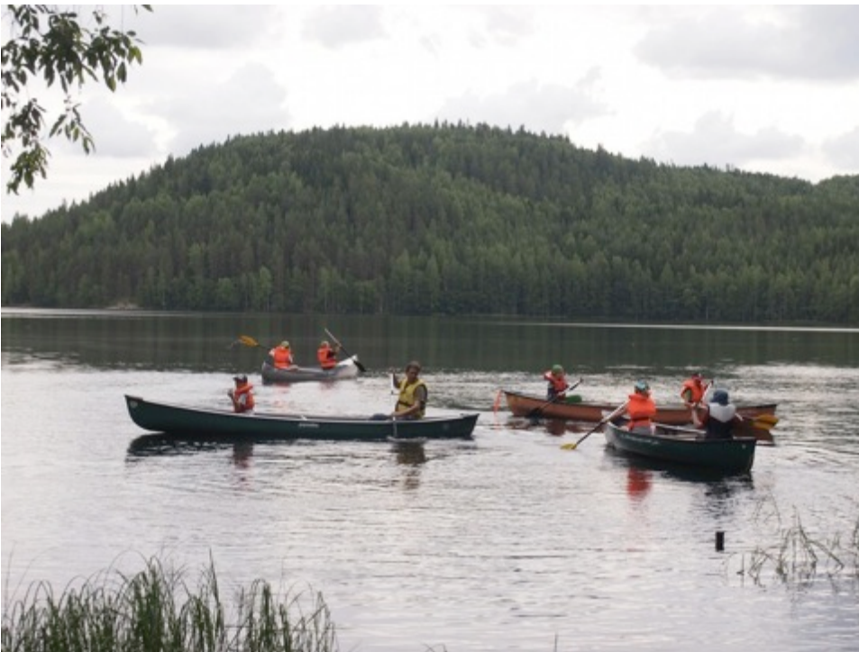
Melonnan riemuja tyynellä Saimaalla.