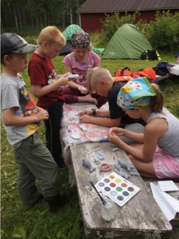
Itse tehdyt savinorpat maalattiin mukavan värisiksi.