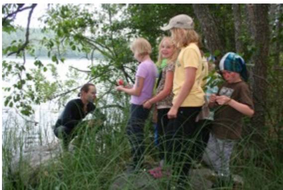
Satuseikkailu, Vetehinen antaa neuvoja.