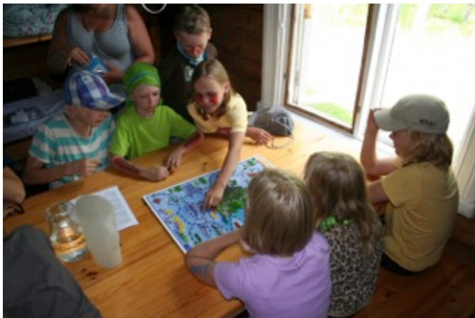
"Kuutin seikkailut" –lautapeli