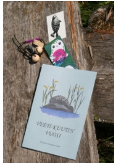
SLL:n lahjoja leiriläisille.