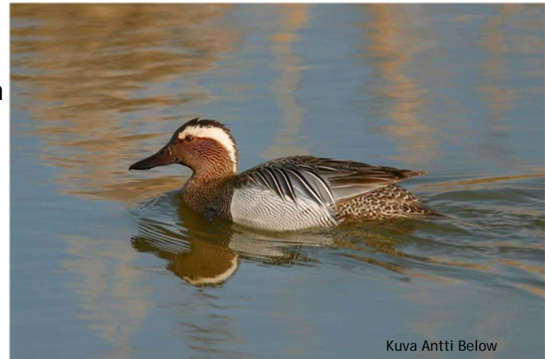
Kuva Antti Below