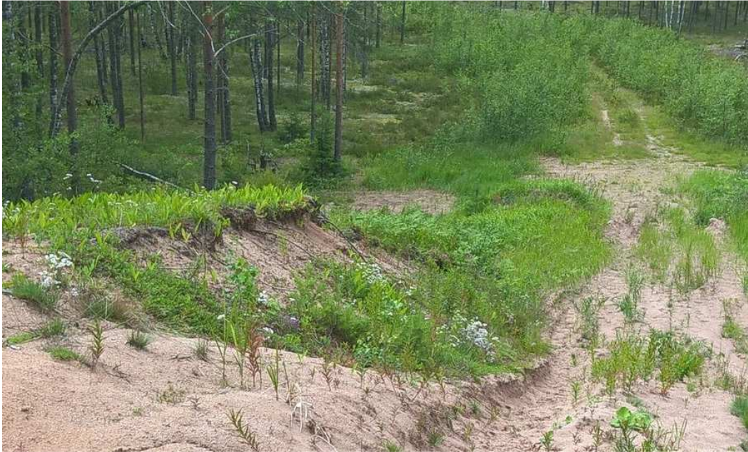
Kuva 2. Uusi esiintymä Palokujalla 1 (nro 14).