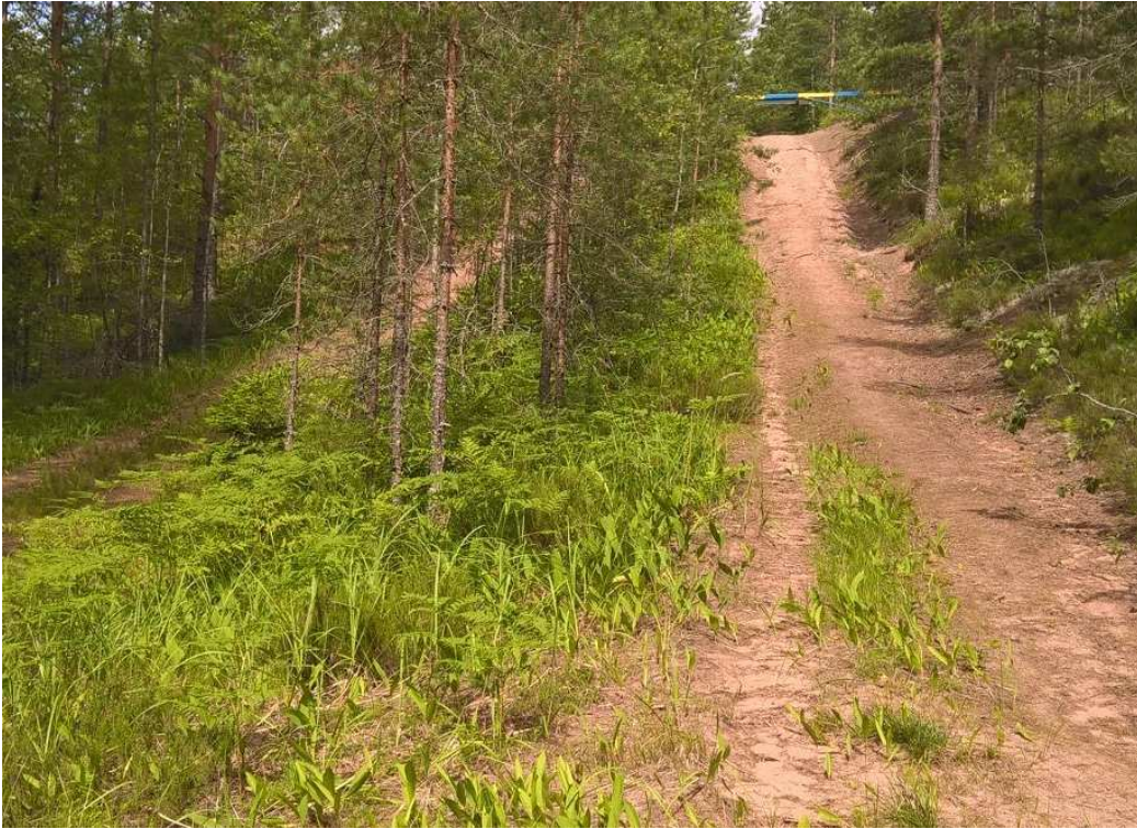
Kuva 3. Umpeenkasvava esiintymä (nro 13).

Alueen merkittävin uhka lajille on umpeenkasvu. Ainoastaan esiintymä nro 13 (Säkylänharju N) on kiireellisesti hoidettava koska pois käytöstä jääneen tien reunoille on kasvanut varjostavaa mäntyä.