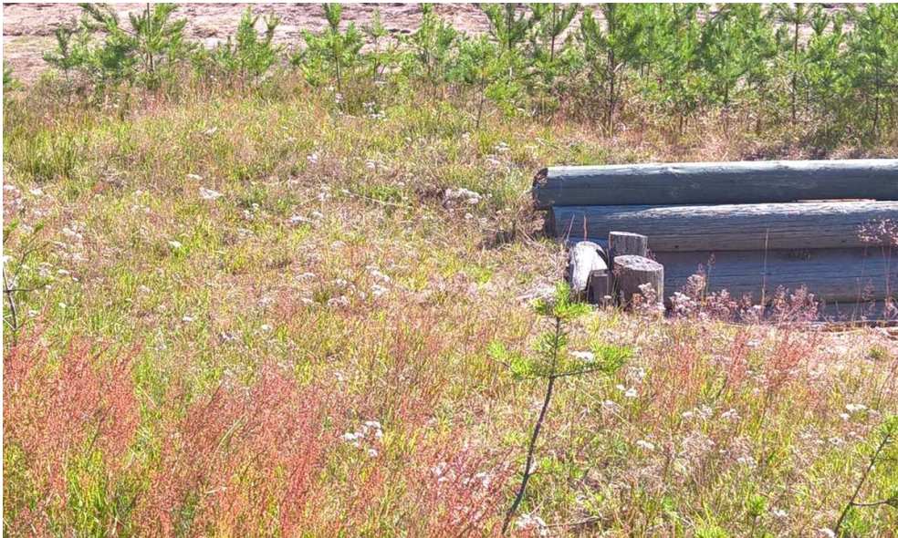
Kuva1. Esiintymä Maastoampumaradalla (nro 3).

Kartoitetut havaintopaikat tallennetaan Metsähallituksen LajiGis -järjestelmään.