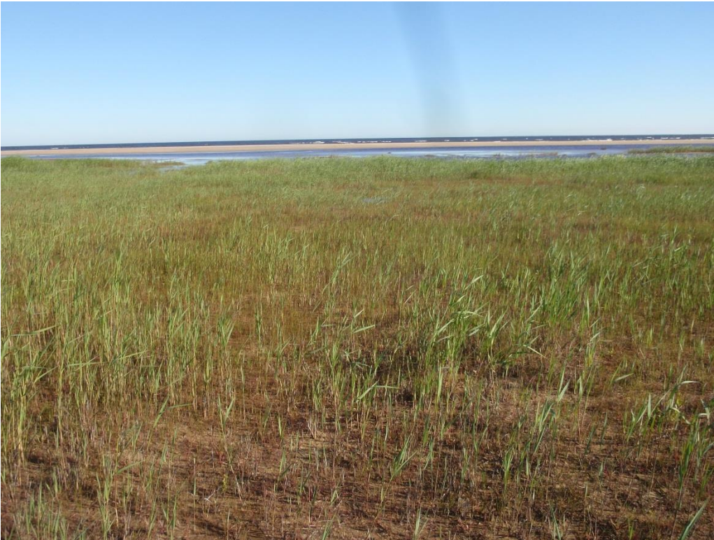
Kuva 3.5. Kosteä niitty dyynin ja rantaviivan välisellä kaistaleella ei ole varsinainen paahdeympäristö. (kohde T3).