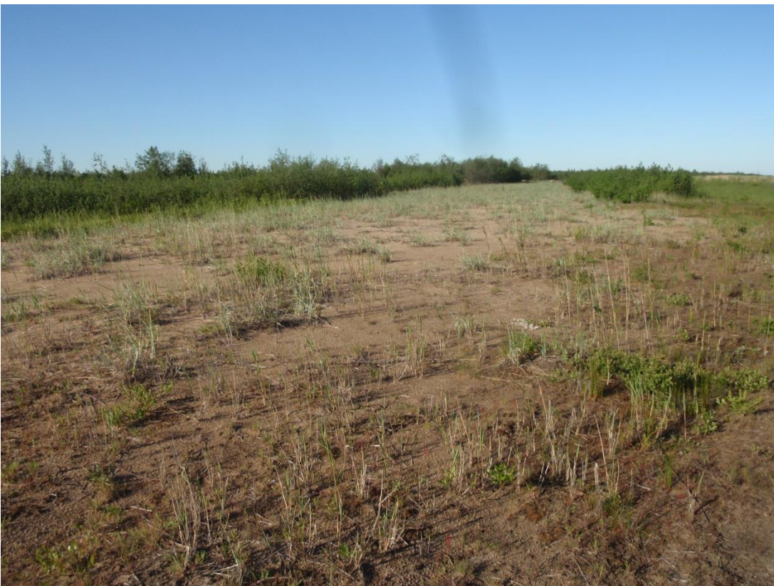
Kuvat 3.3. & 3.4. Tauvon dyynialue on kapea ja umpeutuu helposti reunoilta. Kohteella ei ole merkitystä paahealueiden huomionarvoisten pikkuperhosten elinympäristönä. (kohde T1).