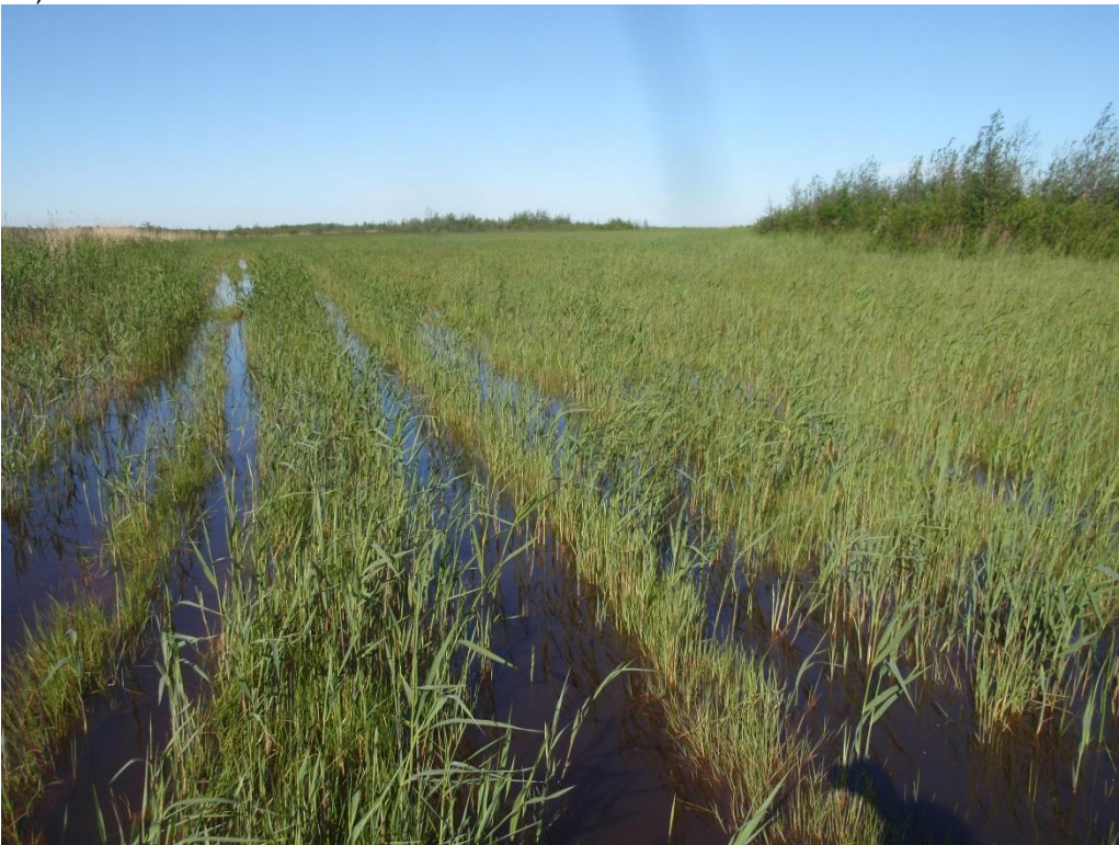
Kuva 3.6. Dyynialueen mantereen puoleinen kosteikko joutuu veden valtaan meriveden noustessa normaalia korkeammalle (kohde T2).