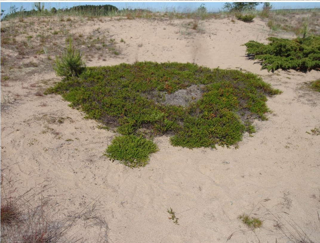
Kuvat 2.5. & 2.6. Dyynisukulakoin ja dyynisammalkoin elinympäristöä Storsandenin harmaiden dyynien avoimessa osassa (kohde U2).