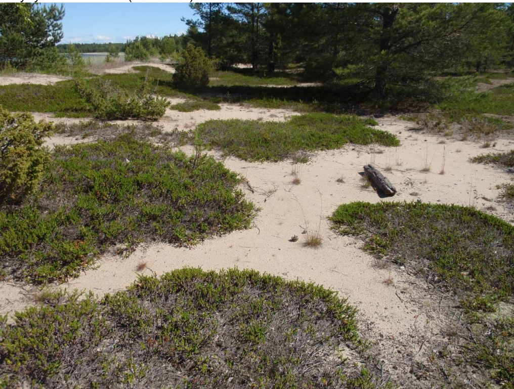
Kuva 2.8. Dyynisukkulakoin, korukaitakoin ja dyynisammalkoin elinympäristöä itäisellä avohiekkaisella dyynilaikulla (kohde U2)