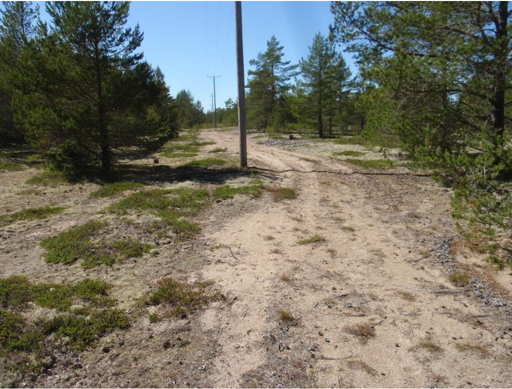
Kuva 2.7. Harmaiden dyynien umpeutuneessa osassa dyynisukkulakoille sopivia avohiekkaisia laikkuja on säilynyt vain tieuralla (kohde U2).