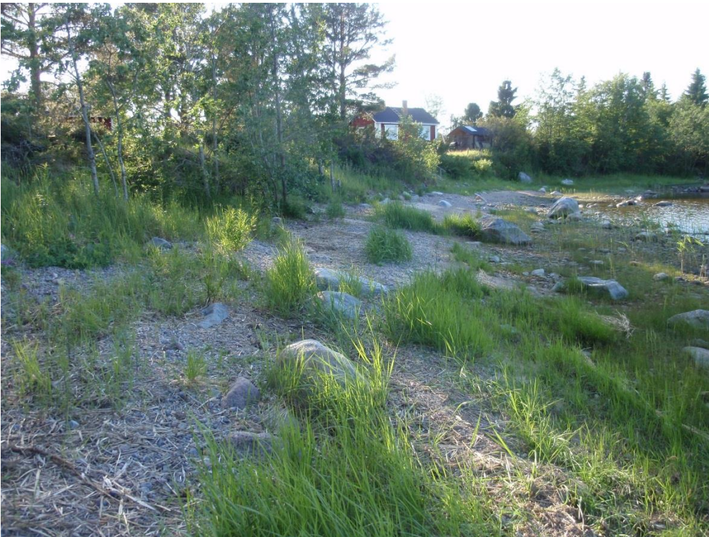
Kuvat 2.13. & 2.14. Lotanin saaren eteläkärjen rantaniityllä ei ole merkitystä paahtalueiden huomionarvoisille pikkuperhosille, vaikka kohde onkin lähes luonnontilainen. (kohde U3).