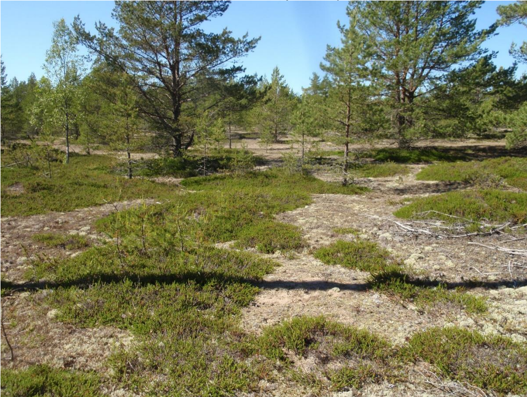
Kuva 2.12. Harmaiden dyynien alueella maanpinta on monin paikoin sammaloitunut, ja paahteiset alueet muuttuneet sopimattomiksi vaativimmille paahdeperhosille. (kohde U2).