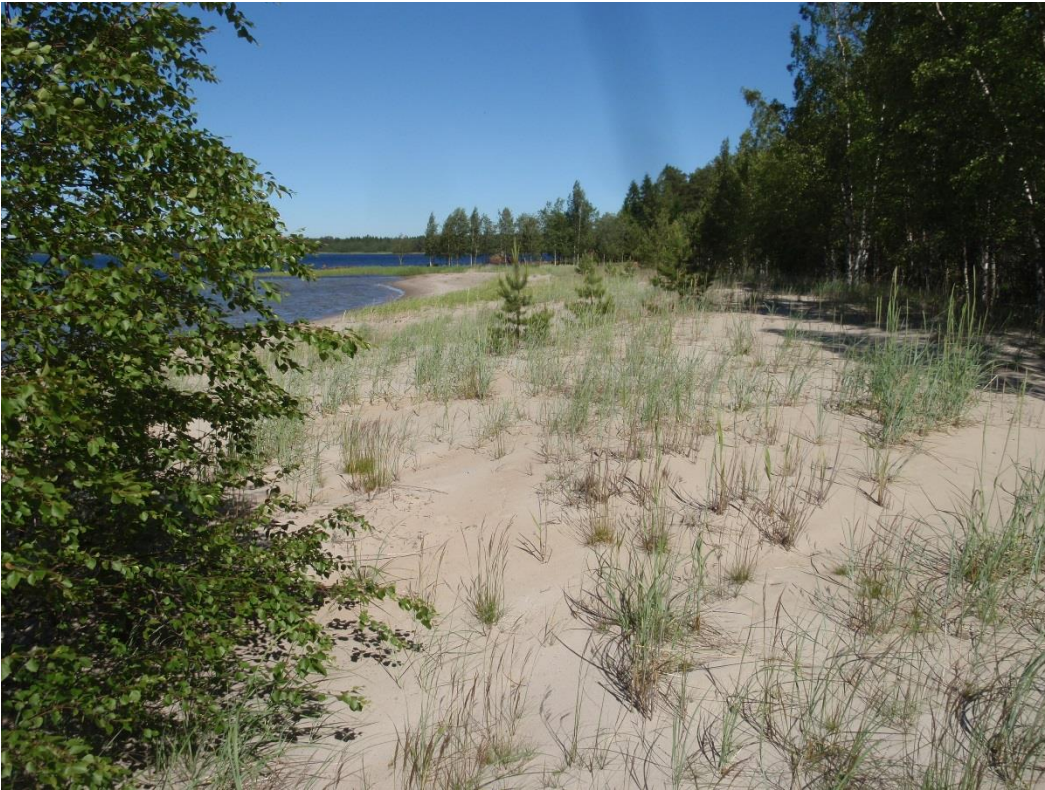
Kuva 2.11. Rantavehnnää kasvava dyynikaistale jatkuu läpi koko kartoitusalueen (kohteen U1 itäpääty).