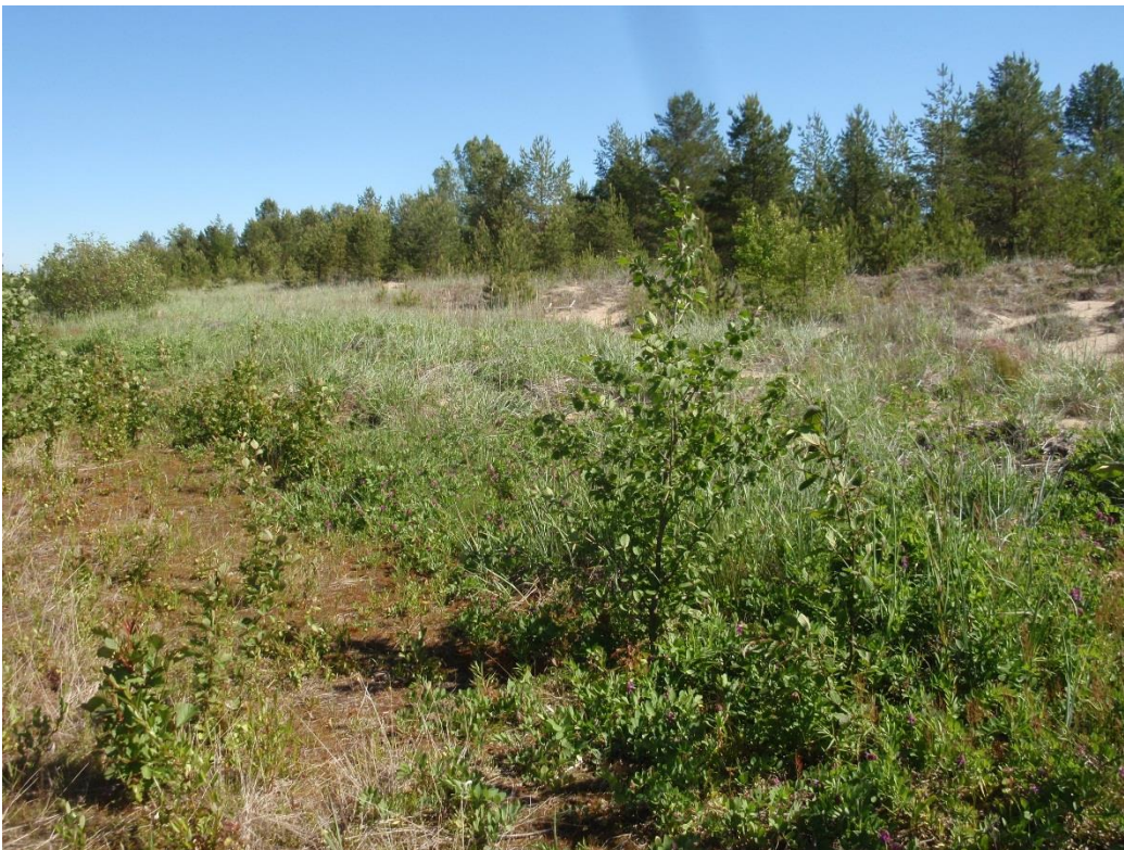
Kuvat 2.9. & 2.10. Rantavehnnädyynit rantaviivan tuntumassa ovat tärkeitä elinympäristöjä myrkkypistiäisille, mutta huomionarvoisille pikkuperhosille niillä ei ole merkitystä. (kohde U1).