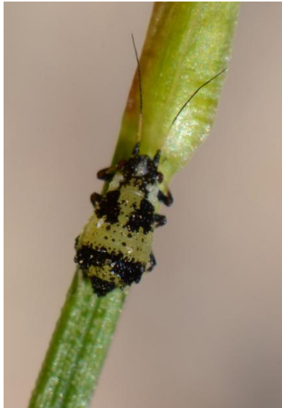
Hietikkosarakirva ( Iziphya bufo )