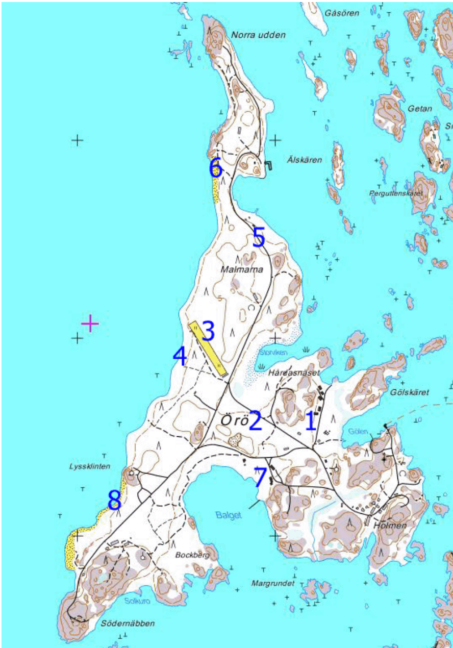
Kartta 2. Öron nivelkärsäiskartoitusten kohteet.