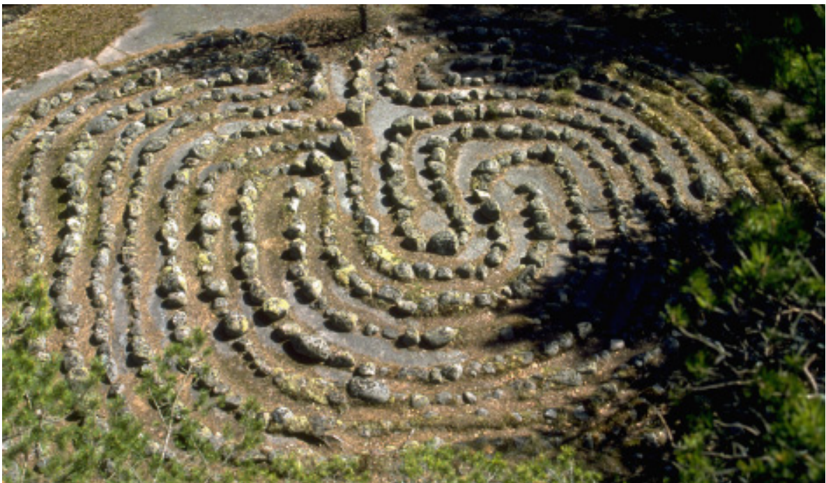
Jatulin tarha, Itäisen Suomenlahden kansallispuisto. Esihistorialliset ja historialliset muinaisjäänne- kset, kuten vanhat uponneet laivat ovat osa Suomen kulttuuriperintöä. Metsähallituksen hoitamilta alueilta on kirjattu lähes kaksi tuhatta tällaista kohdetta.

Mielestämme erinomainen tietovaranto on vielä aika hajanainen eikä sitä ole analysoitu koko- naiskuvan saamiseksi Suomen luonnonsuojelu- alueiden hoidon tehokkuudesta. Hajallaan oleva tieto ei myöskään tue sopeutuvan suunnittelun kulttuuria, varsinkin jos puhutaan suojelutoimi- en vaikuttavuudesta. Siksi suosittelemme Puisto- jen tila -raportin tekemistä säännöllisesti (vaik- kapa viiden vuoden välein). Raporttiin kerättäi- siin ja siinä analysoitaisiin tietoa helposti ym- märrettävässä muodossa. Joitakin ajatuksia puisto- jen tilan raportoinnista on esitetty tämän jul- kaisun osassa 4.