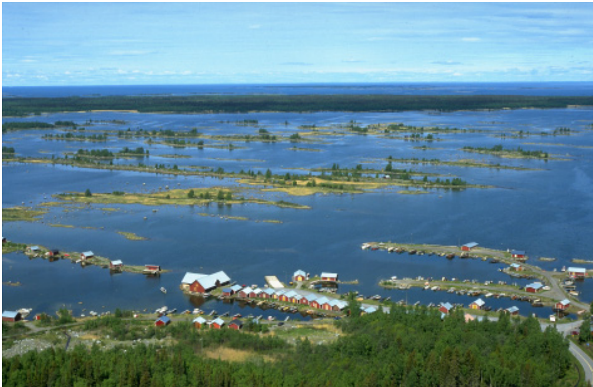
Björköby Merenkurkun saaristossa. Saariston maa- ja vesialueet ovat valtion, kuntien ja yksityisten omistuksessa. Metsähallitus, alueellinen ympäristökeskus ja kunnat tekevät yhteistyötä, jotta omistusoloiltaan pirstaloituneen alueen luonnon ja kulttuuriperinnön suojeluun löytyisi kaikkien tahojen kannalta hyviä ja kestäviä tapoja riippumatta siitä, kuka alueet omistaa. Merenkurkun alue nimettiin hiljakkoin Unescon maailmaperintöluettelon aielistalle. Merenkurkun ainutlaatuinen geologinen piirre on DeGeerin moreenit, jotka nousevat kapeina maakaistaleina merestä.

Suosittelimme, että biodiversiteettisopimuksen suositusten henki ja Natura 2000 -alueiden tavoitteet otetaan suunnitelmallisesti huomioon laadittaessa luontopalvelujen seuraavaa visiota vuonna 2007 niin, että Suomen luonnonsuojelualueiden pitäisi laajentua käsittämään koko maa- ja vesiekosysteemi. Tätä varten tulisi kehittää entistä integroidumpia suojelusuunnitelmia. Varsinkin maan eteläosissa, missä yksittäiset suojelualueet eivät ole tarpeeksi suuria koko ekosysteemin ylläpitämiseksi, toiminnan onnistuminen riippuu pitkällä tähtäimellä siitä, miten Metsähallitus toimii yhdessä alueen muiden maanomistajien kanssa. Tehokkaita puskuri- ja siirtymävyöhykkeitä, käytäviä ja verkostoja voitaisiin luoda vaikkapa vapaaehtoisin sopimuksin ja pyrkimällä jonkin asteisiin kompromisseihin. Tällaiset ratkaisut pitäisi kirjata yleisiin toimintalinjauksiin, joilla voitaisiin helpottaa Natura 2000 -verkoston toteutusta.