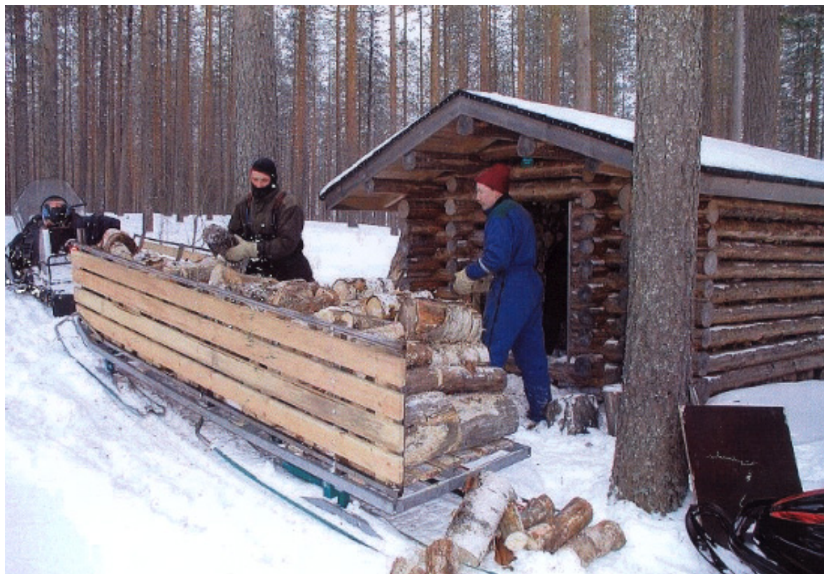
Polttopuuta kävijöille, Ruunaan luonnonsuojelualue. Puuhuoltoon on suunnattu paljon Metsähallituksen kenttähenkilöstön työpanosta. Polttopuukuljetukset tehdään talviaikaan, jotta ympäristövaikutukset voidaan minimoida.

Muihin maihin verrattuna valtion budjettirahoituksen taso on yleisesti ottaen hyvä. Huomaamme kuitenkin, että henkilöstön määrä on aika niukka. Se aiheuttaa huolta monille suojelualueilla työskenteleville varsinkin, kun uusien suojelualueiden ja uusien tehtävien määrä lisääntyy. Näin on käynyt mm. varsinkin siellä, missä